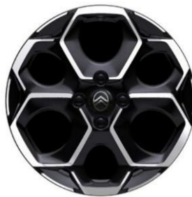
17-tuumaiset kevytmetallivanteet Atacamite