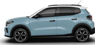
Blue Monte Carlo (sininen)