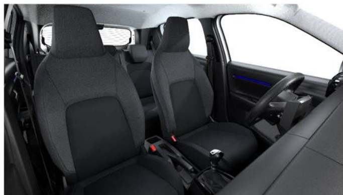
Sisustus YOU versioissa: Kangas musta/harmaa