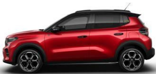
Rouge Elixir met. (punainen)