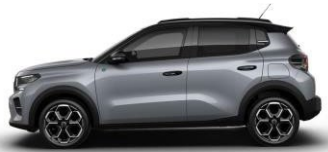
Gris Mercure met. (hopea)