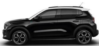
Noir Perla Nera met. (musta)