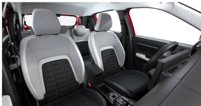
Sisustus MAX versioissa: METROPOLITAN GREY – Citroën Advanced Comfort -istuimin