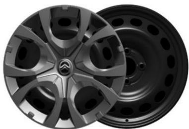
16-tuumaiset teräsvanteet Pyrite-koristekapseleilla