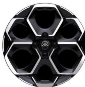
17-tuumaiset kevytmetallivanteet Atacamite