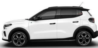
Blanc Banquise (valkoinen)