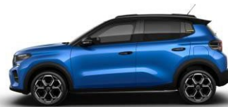
Bright Blue met. (sininen)