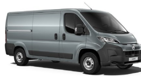
P02B | Thunder Gray (pastelliväri)