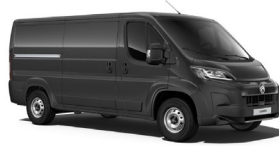
M0E9 | Graphito Gray (metalliväri)