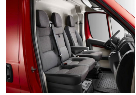
BUFX | Darko kangasverhoilu